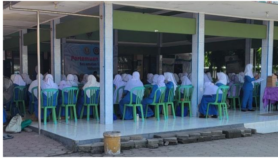
Gambar 1. Sosialisasi SIPRAJA pada Rapat Ikatan Guru Taman Kanak-Kanak Indonesia