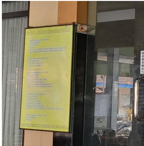
Gambar 5. Papan Informasi Persyaratan Berkas Pelayanan